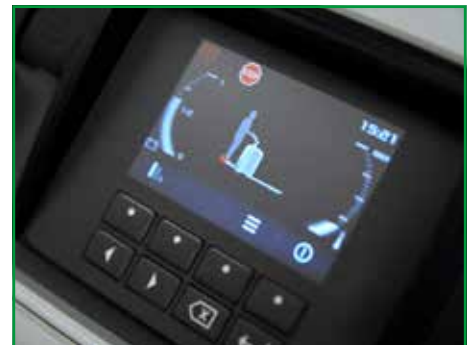
Multifunctioneel display: een overzichtelijk geavanceerd grafisch scherm met een eenvoudige bediening.