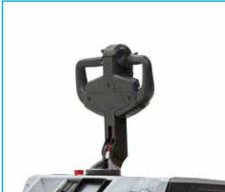
Power besturing met elektrische stuurbevestiging (verkorte disselarm)