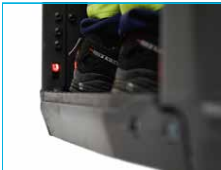
De optionele voetbescherming stopt de truck automatisch wanneer de voeten van de bestuurder buiten het platform komen.