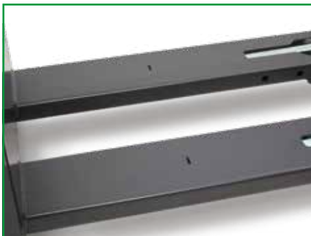
Markering op vorken voor het correct plaatsen van pallets.