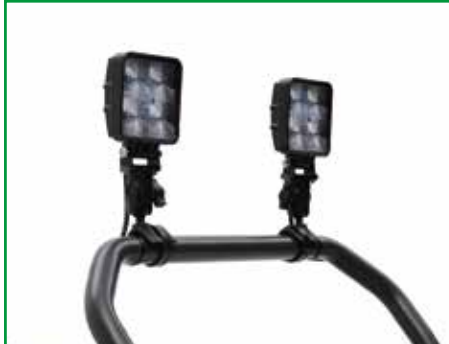
LED werkverlichting voor goed zicht op de vorken tijdens het rijden in donkere omstandigheden.